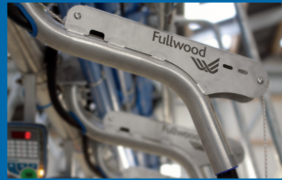
Arm (RVS) voor optimale slanggeleiding.