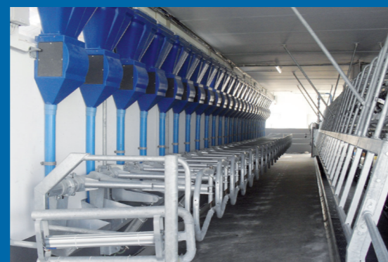
De stal is ook voerend te leveren.