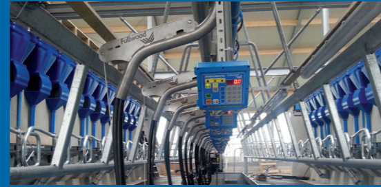
Alle materialen strak boven in de put gemonteerd.