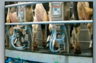
Optimale bereikbaarheid uier