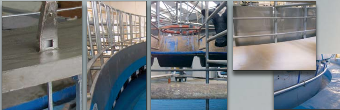
Beton uit één stuk, aflopend naar binnen of naar buiten.